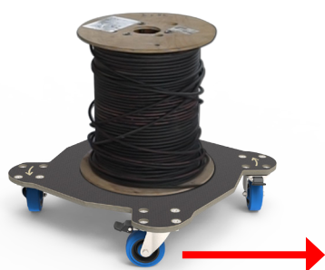
TRANSLATION POUR TRANSPORTER

Gagnez du temps et améliorez vos conditions de travail grâce au SpinBle® !