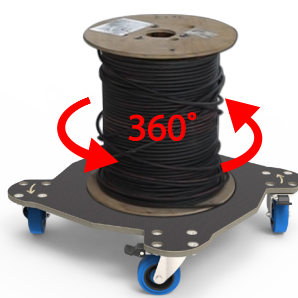
ROTATION POUR DÉROULER-ENROULER